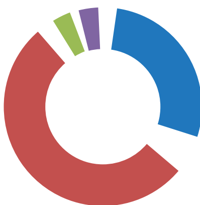
2. Sklad Umirjeni